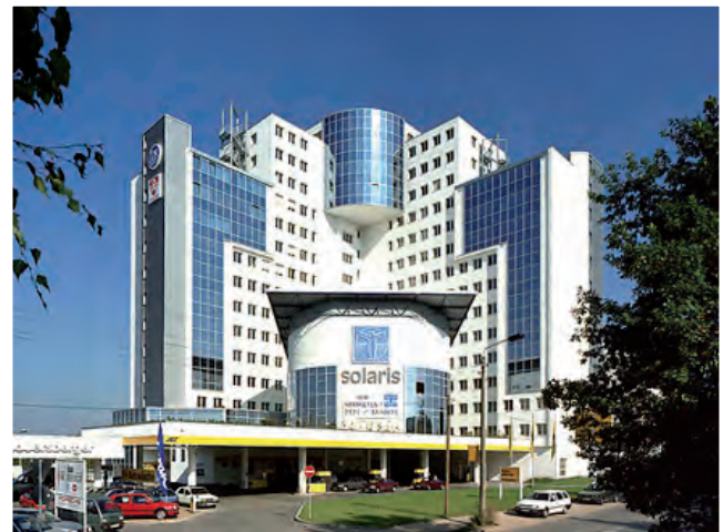
Sitz des eGovernment-Kompetenzzentrums in Chemnitz